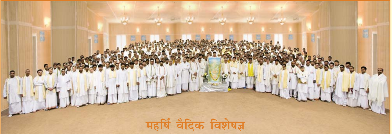
महर्षि वैदिक विशेषज्ञ

महर्षि शिक्षा संस्थान आधुनिक शिक्षा के विद्यार्थियों को महर्षि वेद विज्ञान की शिक्षा तो देता ही है, साथ-साथ विशुद्ध रूप से वैदिक शिक्षा प्राप्त करने वाले विद्यार्थियों को भी प्रायोजित करता है जिससे वे साधनामय वैदिक दिनचर्या का पालन करते हुए वैदिक वांगमय का विधिवत् अध्ययन गुरु-शिष्य प्रणाली में कर सकें।