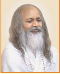
His Holiness Maharishi Mahesh Yogi

E-mail - egyan@mahaemail.com and egyanmonthly@gmail.com • Web site - www.e-gyan.net 7 September 2010, Tuesday