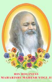
HIS HOLINESS MAHARISHI MAHESH YOGI JI